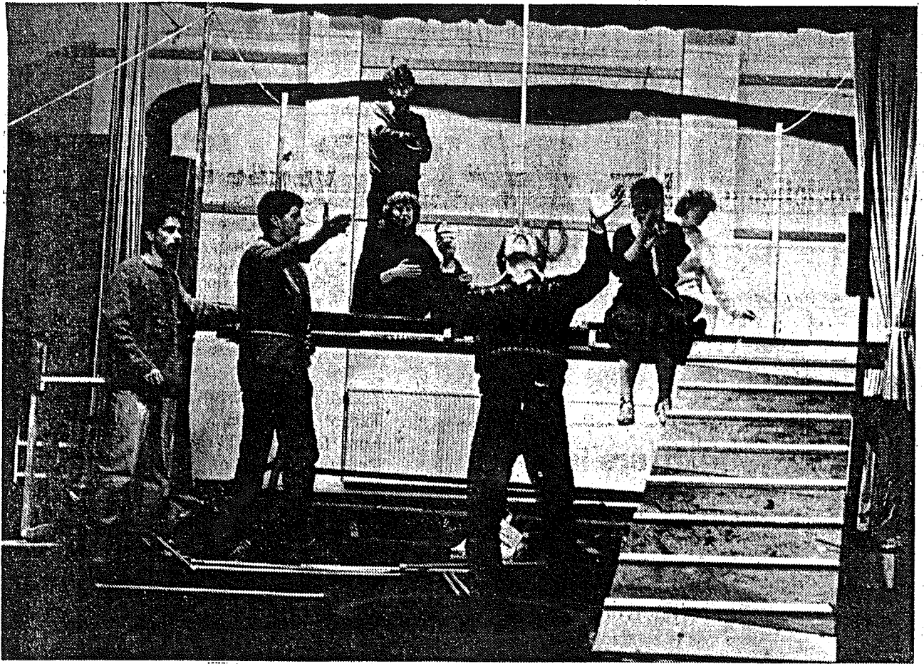
Spot '70 repeteert

WARMENHUIZEN - Er heerst grote bedrijvigheid in het Dorpshuis. Elke week weer stroomt er op de woensdagavond een groepje enthousiaste mensen de grote zaal binnen. Alles wordt aan de kant geschoven en weer andere spullen op een vastgestelde plaats neergezet. Dan worden er zakken met kleding leeggeschud om tot een keuze te komen wat er voor het te spelen stuk geschikt is en wat niet. Er wordt gepast en gemeten en er wordt overlegd wat er aan de kleding veranderd moet worden.